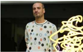
Hector Madera / www.lectormadera.com / @studiomadera

Su obra forma parte de la Colección CIAC, Acervo del Centro de la Imagen y de la colección del Museo de Arte Moderno de México. Su trabajo ha sido expuesto en México, Francia, Estados Unidos, España, Holanda, Turquía, Alemania, Austria, Argentina y Japón.