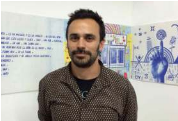
Ramiro Chaves / www.chavesphoto.com / @rrraammchaves

Estudio Cinematografía y TV en la Universidad Nacional de Córdoba y Fotografía en la Escuela de Artes Lino E. Spillimbergo. Vive y trabaja en México desde el año 2002. Seleccionado en la XI Bienal de Fotografía, Centro de la Imagen, México, 2004. Exposición individual Proyecto Canada, Museo de Arte Carrillo Gil, México, 2006. Publicación del libro Domingos, Editorial Diamantina, México, 2006. Fue seleccionado en Descubrimientos de PhotoEspaña, España, 2009. Residencia Miradas Cruzadas, Francia, 2010.