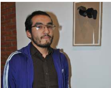
Cristian Camacho / www.christian-camacho.com / @ccamachoreynoso

Estudió Artes Plásticas y Visuales en la Escuela Nacional de Pintura, Escultura y Grabado “La Esmeralda” (2010-2014). Fue artista residente en la Galería Red Gate ubicada en Beijing, China 2014-2015. En este país colaboró en una exposición colectiva “In Between You and Me” y su primera exposición individual: “A Neighbor With Hair Rollers”. Ha participado en diferentes exposiciones colectivas en la Ciudad de México, y el extranjero incluyendo: “Resonancias del Jardín de las Delicias”, Museo de Arte Carrillo Gil, 2016, “Le Gran Luxe”, Centro Futurama, 2017, “Kitchen Debate” Rawson Projects and Regina Rex, Nueva York. Además de su primer individual en México, “QUARK”, Bikini Wax, 2015. Coordina “Lanz Arte para Niños” un taller de educación artística enfocado a niños en la Ciudad de México. Enseñó y coordinó talleres de arte contemporáneo para niños en diferentes espacios como: Museo Universitario de Arte Contemporáneo (MUAC), Nixon en la ciudad de México, el Centro de Arte Contemporáneo Vincom (VCCA) y WORK ROOM FOUR en Hanoi, Vietnam.